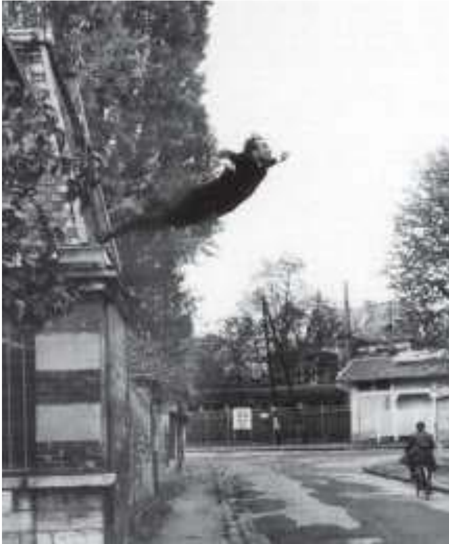
NGHỆ SĨ YVES KLINE 1 QUẢNG MÌNH VÀO KHÔNG TRUNG, NĂM 1960

1. Yves Kline (1928-1962) là một nghệ sĩ tài hoa người Pháp, người tiên phong trong lĩnh vực nghệ thuật trình diễn (performance art).